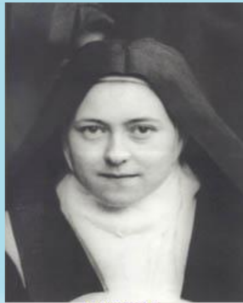
聖女小德蘭 St Therese of Lisieux